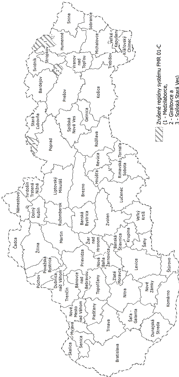
Obr. 84. Regionálny systém FMR 01-B