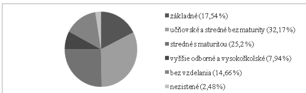
Obr. 121. Štruktúra obyvateľstva obcí Mikroregiónu pod Marhátom podľa najvyššieho dosiahnutého vzdelania v roku 2011 SODB 2011

(18,94%) a spolu s obyvateľstvom so stredným odborným vzdelaním bez maturity tvoria 32,17 % podiel obyvateľov (obrázok 121). Vysoký podiel majú obyvatelia so základným vzdelaním (17,54%) a bez vzdelania (14,66 %). Úplné stredné odborné vzdelanie s maturitou dosiahlo 18,7% obyvateľov mikroregiónu. (SODB 2011) Tento nepriaznivý stav výrazne znižuje konkurencieschopnosť regiónu. Endogénny potenciál je obmedzený štrukturálnymi vplyvmi, pokiaľ sa nezlepší vzdelanostná štruktúra obyvateľstva, tak bude